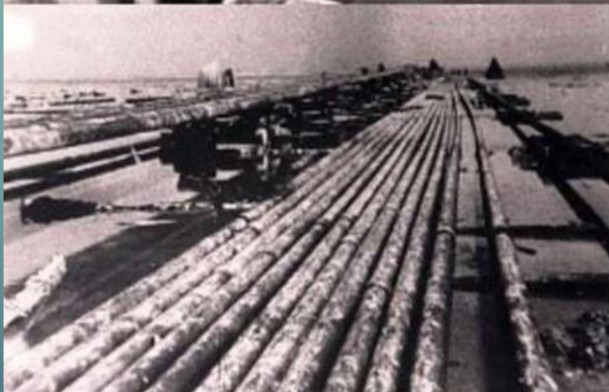
СХЕМА ТРУБОПРОВОДА ЧЕРЕЗ ЛАДОЖСКОЕ ОЗЕРО. 1942 ГОД